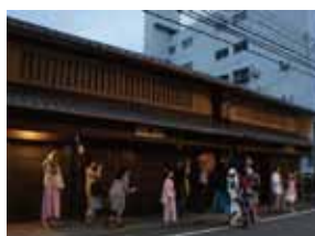
二階囃子を聞きに (7月)