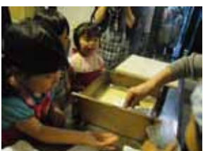
土間の台所で水無月作り (5月)