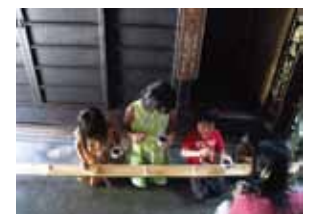
通り庭で流しそうめん (8月)