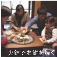
火鉢でお餅を焼く